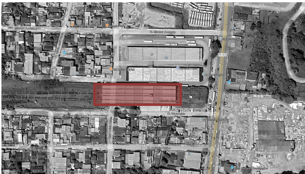
FIGURA 1 – ESTAÇÃO CAMARAGIBE